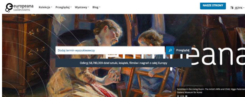
Rysunek 1 Okno startowe portalu Europeana z widoczną wyszukiwarką zasobów

Zbiory na stronie Europeany są pogrupowane w kategorie. Kolekcje obejmują różne zakresy tematyczne z lat 1914-1918, prezentują głównie w formie obrazu zagadnienia muzyki, sztuki, historii naturalnej, mody, fotografii, map i geografii, sportu, migracji, archeologii, gazet. Wystawy online dotyczą między innymi zagadnień mody, muzyki, podróży, jedzenia, sportu, dzieł sztuki. Galerie tematyczne prezentują zjawiska społeczne w różnych okresach historycznych rozwoju Europy. Jednym z przykładów jest zestaw fotografii prezentujący, w jakich warunkach obywatele Europy głosowali w minionych latach, aby wybrać przedstawicieli swoich rządów. Galerie eksponują także dzieła sztuki, znaczki obrazujące narodowe i międzynarodowe symbole, procesy migracji, zjawiska mody, trendy kulinarne poprzez pryzmat reklam czekolady itp.