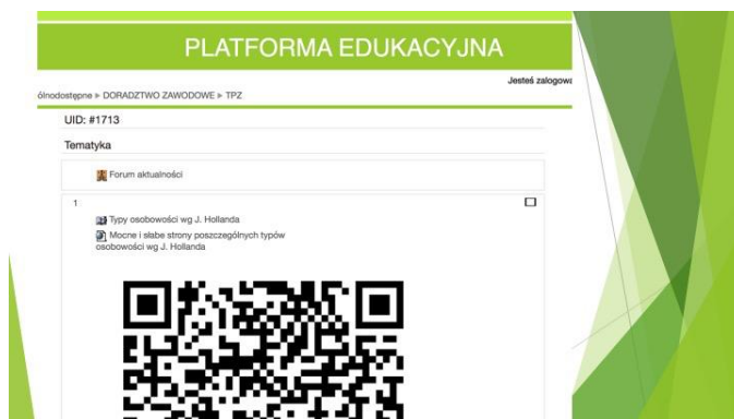
Rysunek 1 Kurs Moodle Test predyspozycji zawodowych na Platformie Edukacyjnej