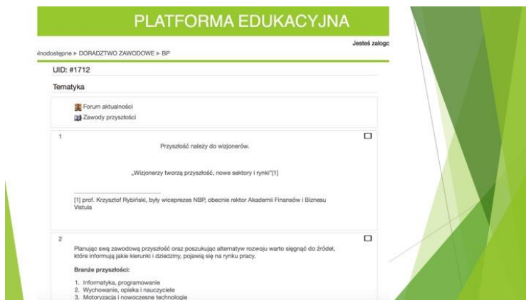
Rysunek 6 Wewnętrzny panel Kursu Moodle Branże Przyszłości na Platformie Edukacyjnej