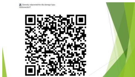
Rysunek 7 Kod QR Formularza Zawody odpowiednie dla danego typu osobowości