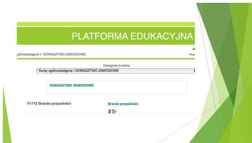
Rysunek 5 Kurs Moodle Branże przyszłości na Platformie Edukacyjnej

(link/hiperłącze aktywne po zalogowaniu na Platformę Edukacyjną)