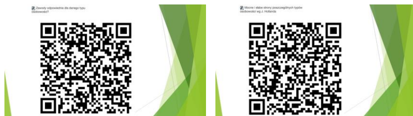
Rysunki 3, 4 Kod QR Formularza Office 365 Mocne i słabe strony poszczególnych typów osobowości oraz Zawody odpowiednie dla danego typu osobowości